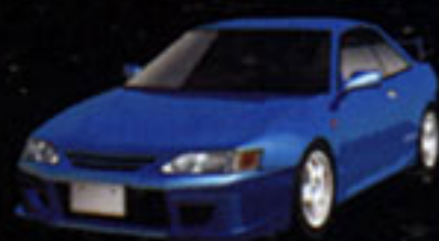
TOYOTA LEVIN BZR