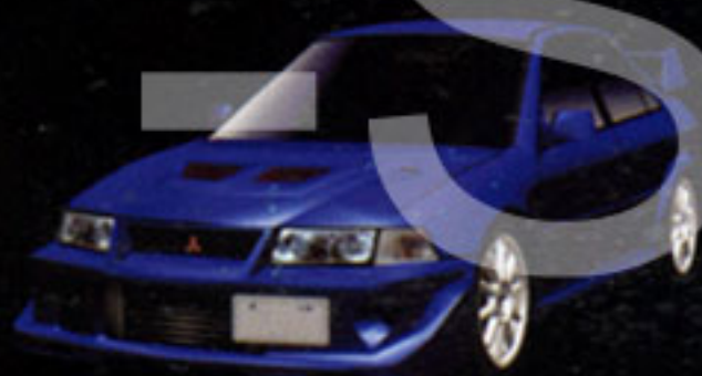
MITSUBISHI LANCER GSR EVOLUTION VI TOMI MAKINEN EDITION