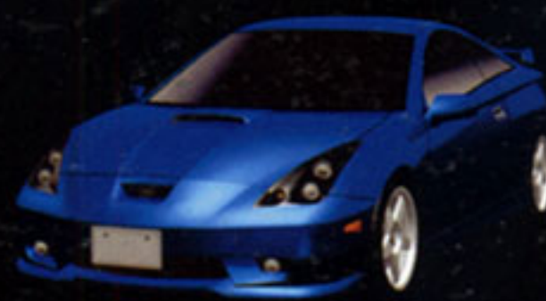
TOYOTA CELICA SS-II