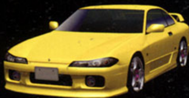
NISSAN SILVIA Spec-R AERO