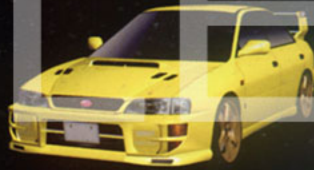
SUBARU IMPREZA WRX Type-R Sti Ver.VI Limited Edition