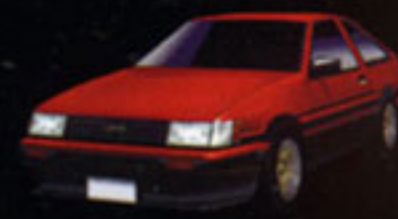
TOYOTA LEVIN GTV