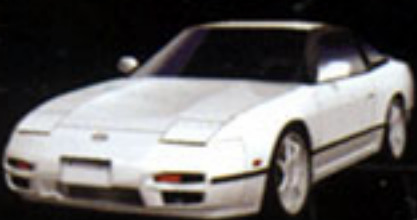
NISSAN 180SX Type-X