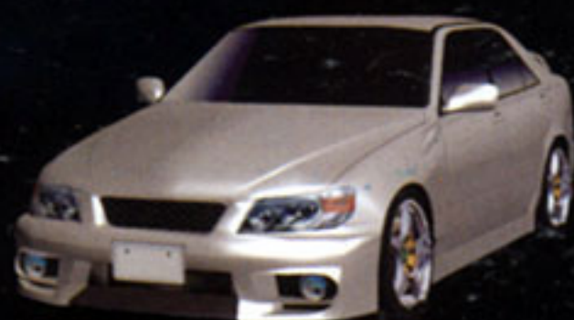
TOYOTA ALTEZZA RS200