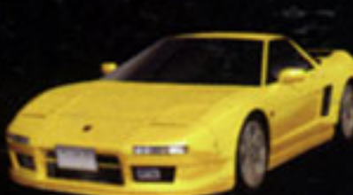
HONDA NSX Type S-Zero