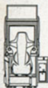
正面 Front view