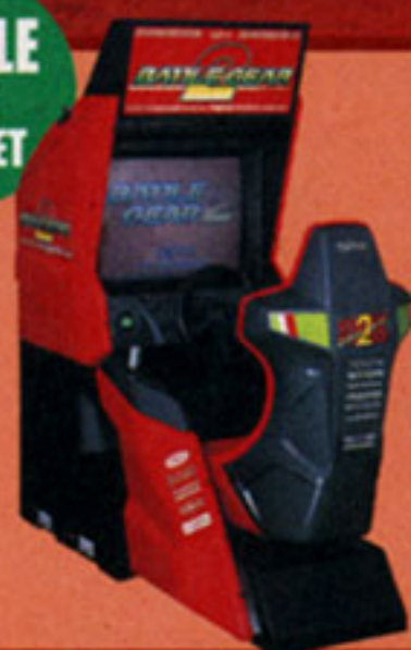
SINGLE SEAT CABINET