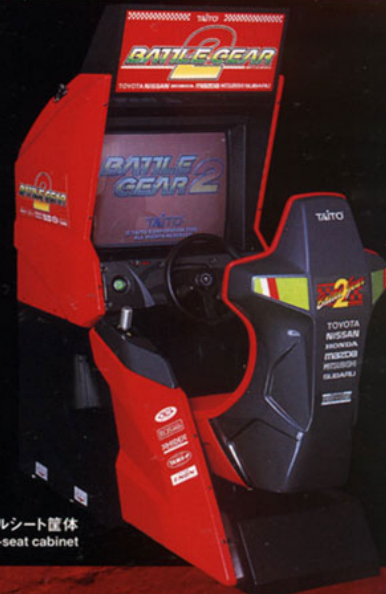
シングルシート筐体 Single-seat cabinet

ビューチェンジ 3種類のビューチェンジが可能 View Change There are three views available. The player can change the view as he/she desires.