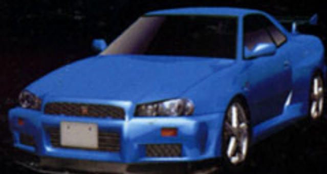
NISSAN SKYLINE GT-R V-Spec