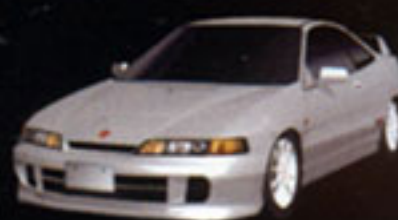
HONDA INTEGRA Type-R