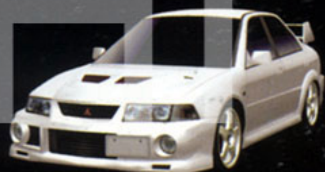
MITSUBISHI LANCER GSR EVOLUTION VI