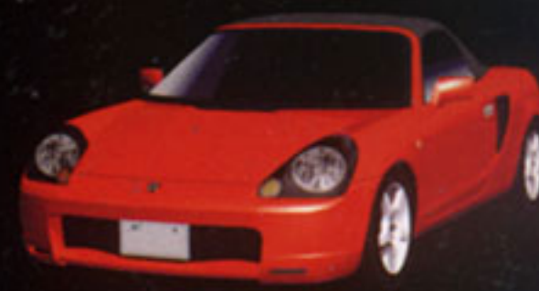
TOYOTA MR-S S EDITION