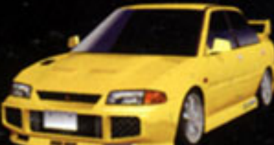
MITSUBISHI LANCER GSR EVOLUTION III