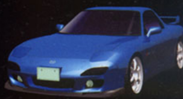
MAZDA RX-7 Type-RS