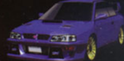
SUBARU IMPREZA 22B Sti