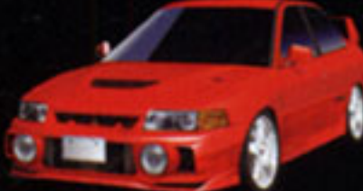
MITSUBISHI LANCER GSR EVOLUTION IV