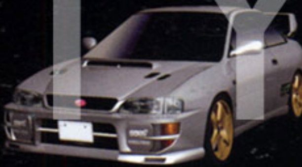
SUBARU IMPREZA WRX Type-RA Sti Ver.VI Limited Edition