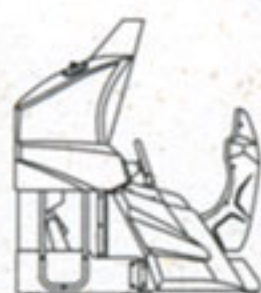
側面 Side view