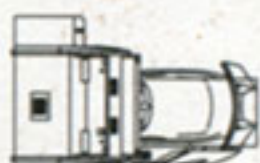
Single Seat Cabinet