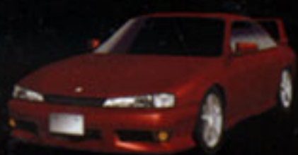
NISSAN SILVIA K's