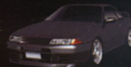
NISSAN SKYLINE GT-R