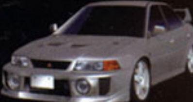
MITSUBISHI LANCER GSR EVOLUTION V