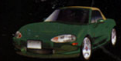
MAZDA ROADSTER 1.6