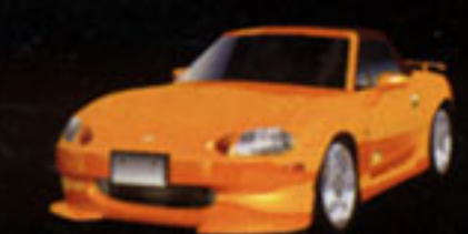
MAZDA ROADSTER 1.8 A-Spec