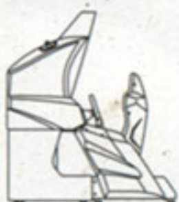
側面 Side view