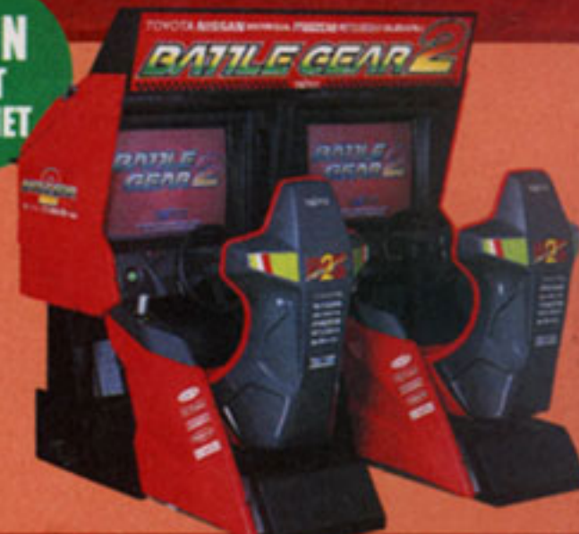
TWIN SEAT CABINET