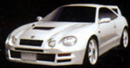
TOYOTA CELICA GT-FOUR