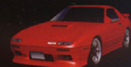
MAZDA SAVANNA RX-7