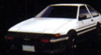
TOYOTA TRUENO GT-Apex