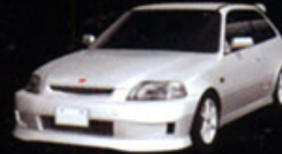
HONDA CIVIC Type-R