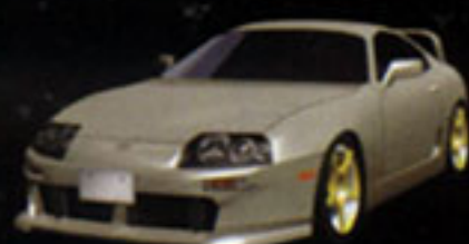
TOYOTA SUPRA RZ

News-making car types including Toyota ALTEZZA, Honda S2000, Nissan SKYLINE GT-R (R34) have been added to the existing 21 car types. Eleven of the existing types have been modified into more sophisticated models. The new series now boasts of a lineup of 29 powerful car types for arcade games. The instrument panel and instruments are provided just like the real ones. This unparalleled virtual reality enhances the player's empathy into the game.