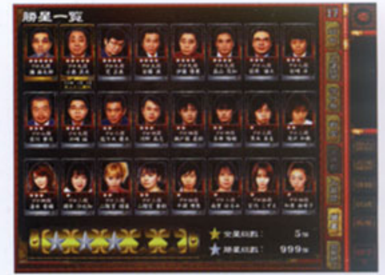
日本プロ麻雀連盟のプロ雀士総勢24名が参戦

■ The top of the best online competition mahjong game authorized by the Japan Federation of Professional Mahjong Players. New tough battles to seize the grand championship crown will now commence!