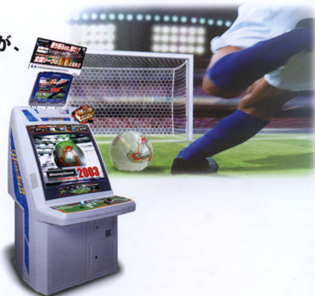
※筐体写真はイメージです。

adidas, the adidas logo, FEVERNOVA and the trigon logo are trade marks which are owned by the adidas-Salomon Group, used with permission.