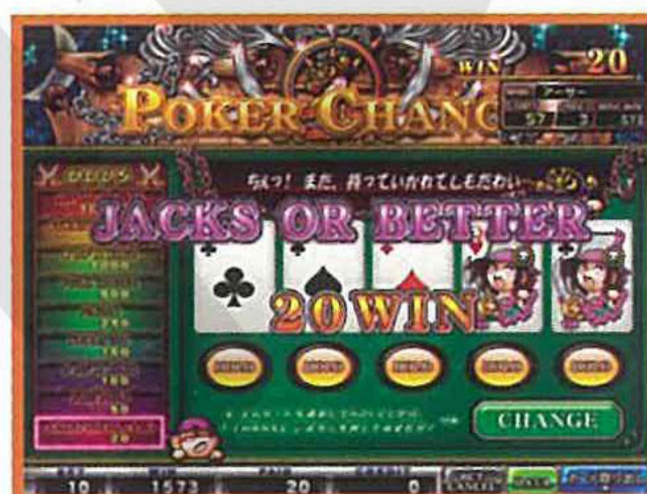
10・J・Q・K・Aシンボル出現で ポーカーチャンスへ!