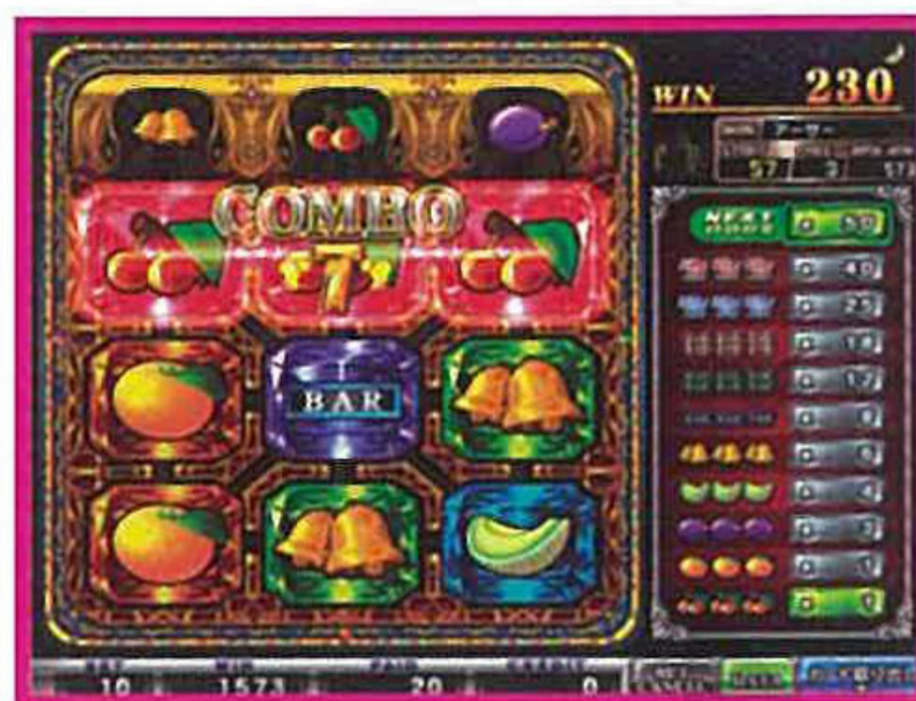
4連鎖以上でコンボボーナス!