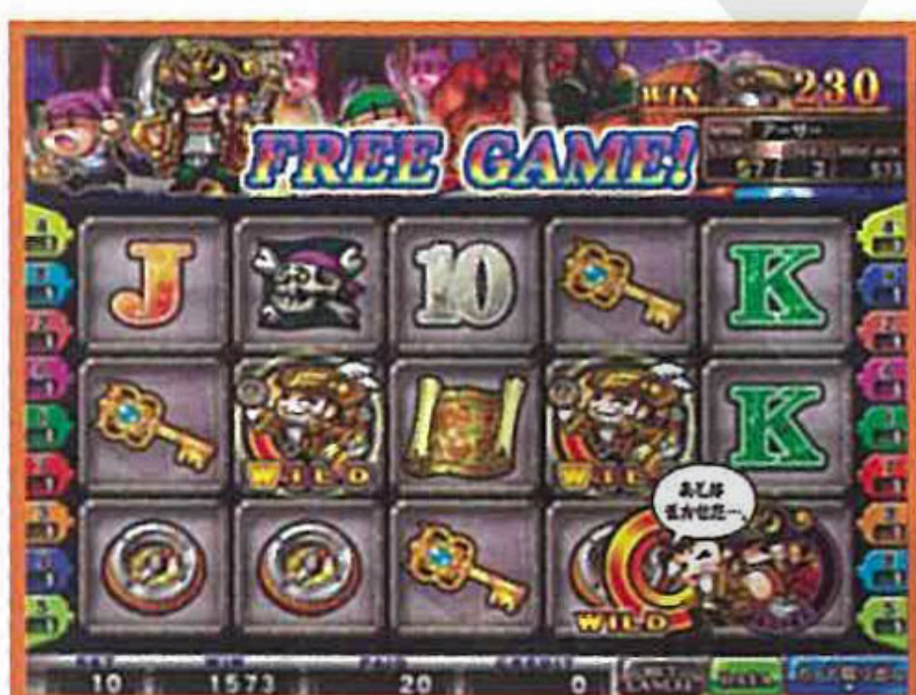
フリーゲーム中は 海賊から逃げ延びろ!

フリーゲームに突入するとリールから冒険家が脱出! 海賊の追っ手から逃げ延びながら宝箱を拾い集めて目指せ高配当! 他にもポーカーチャンスなど新しいフィーチャーが盛り沢山!