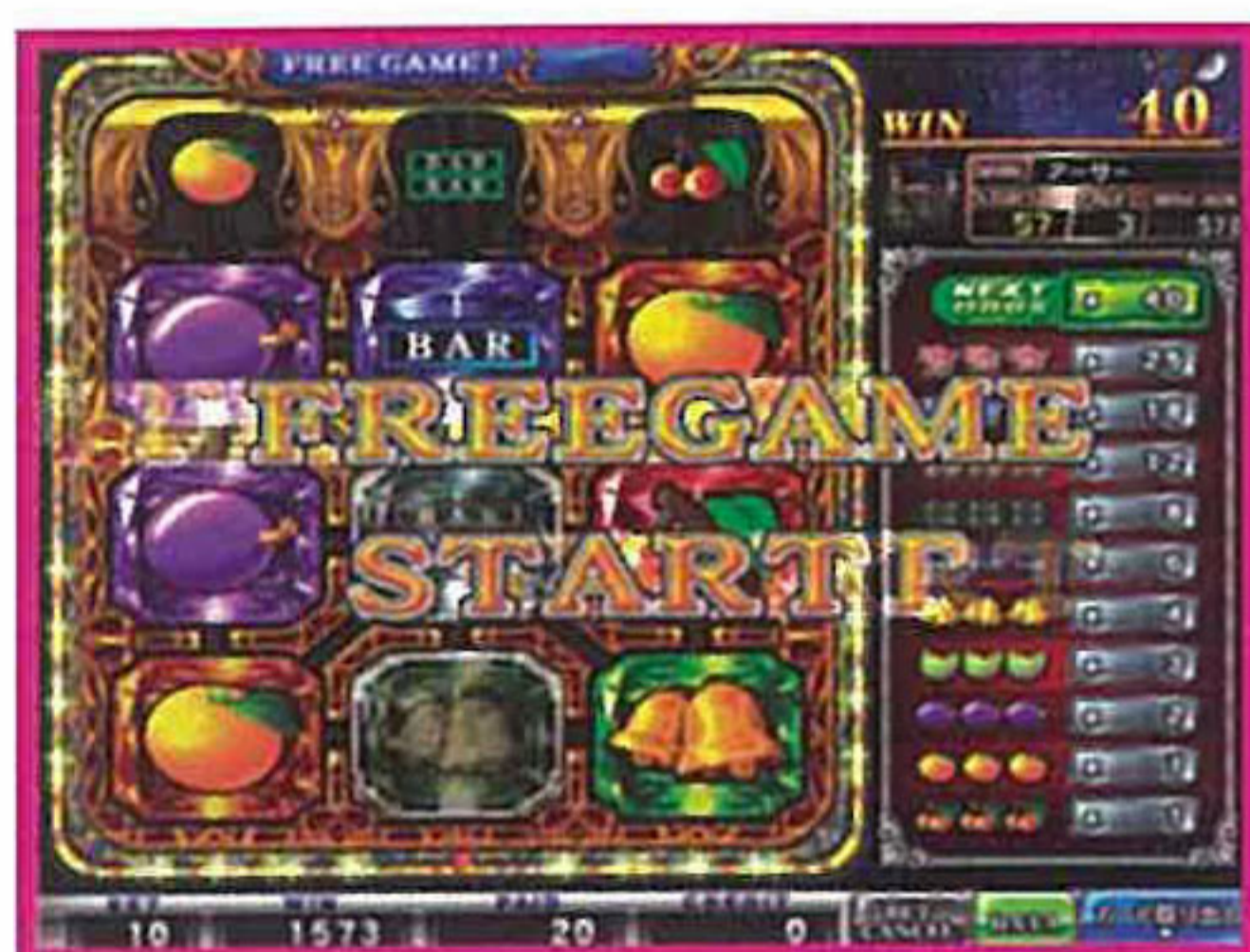
FREEシンボル出現でフリーゲームへ!

シンボルの連続成立によるライン配当アップや連鎖回数によるコンボボーナスなど今までにないフィーチャーが新しい! さらにFREEシンボルやWILDシンボルなどの特殊シンボルが面白さを倍増!